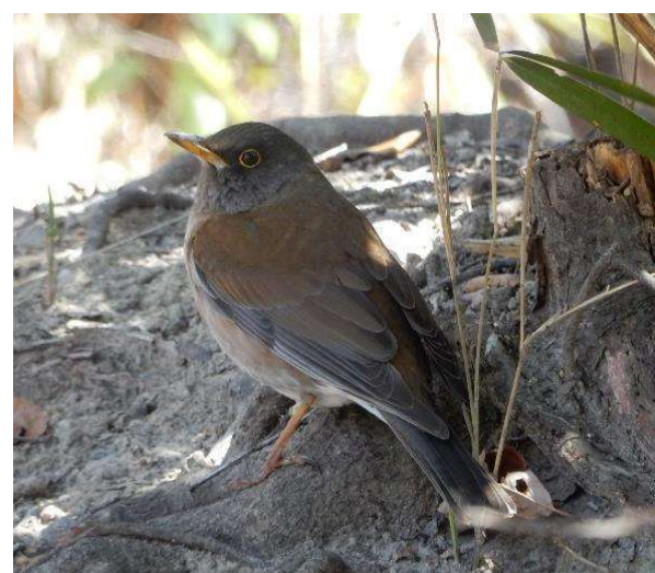
中尾根群落のシロハラ キョロちゃん 住み心地良いそうです