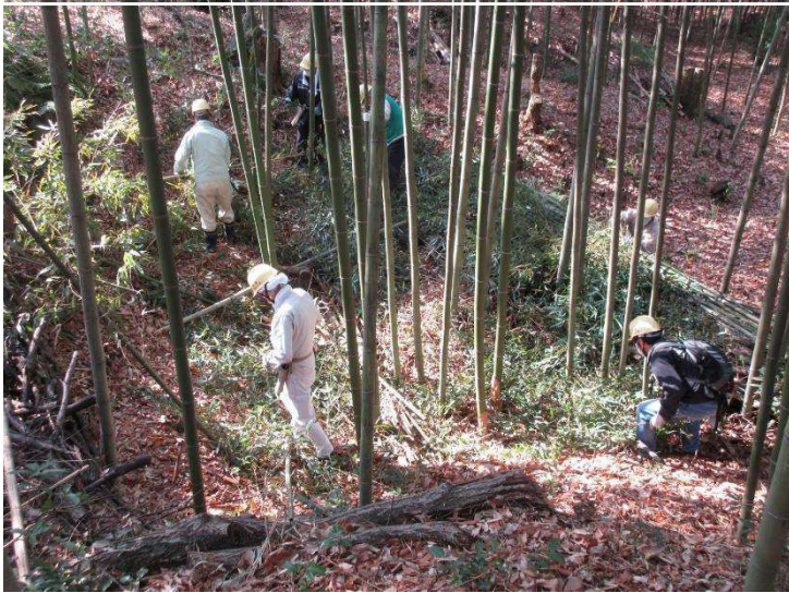
◇ 10日 維持管理 マダケ林