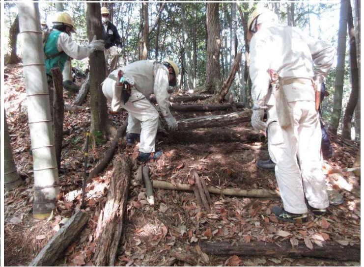
18日 モウソウ竹林階段整備