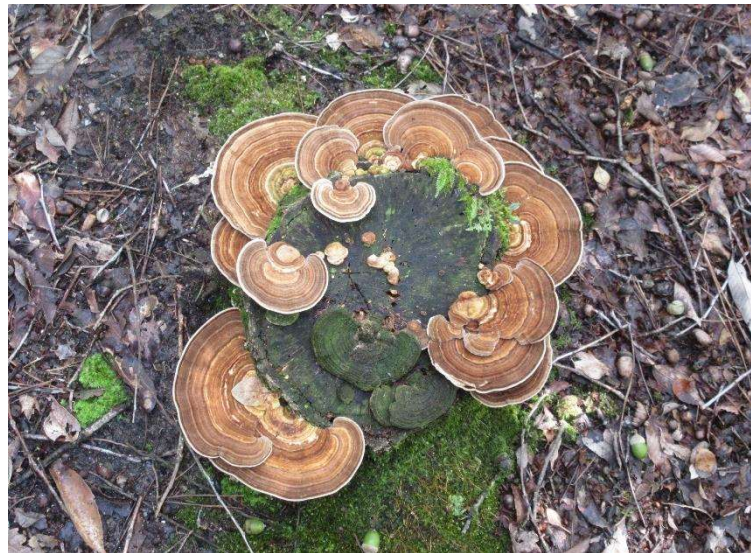
◇ カイガラタケ 南尾根道コバノミツバツツジ群落