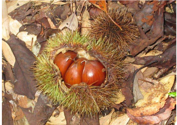
◇ 北尾根の栗 小ぶりで皮をむきは手間だが美味