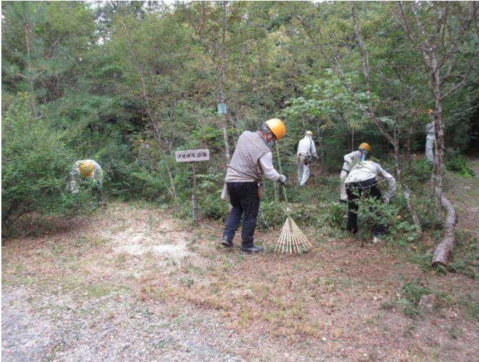
◇ 9月維持管理 アオダモ広場がすっきり