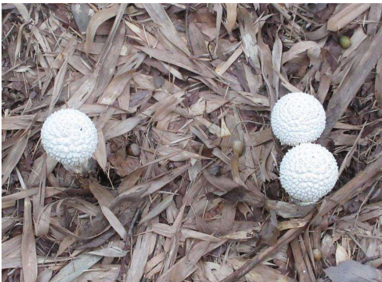
◇ 9月の北高上はキノコ シロオニタケ まるでゴルフボールを置いたようです 竹林の小径