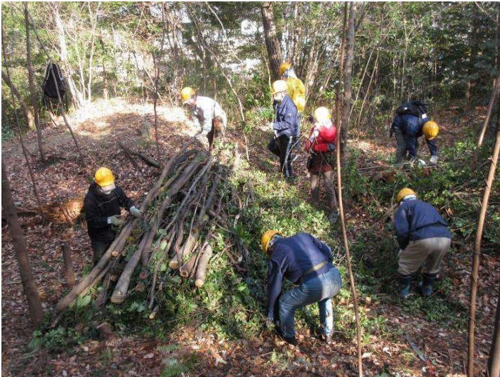
◇ 水晶山緑地整備作業 暗い森が明るい森に