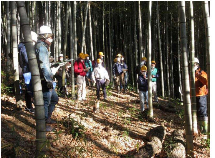
◇ 里山実践講座 竹林整備