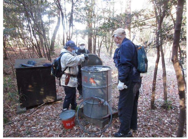
◇ 新年初巡回 防火用水の表面凍結