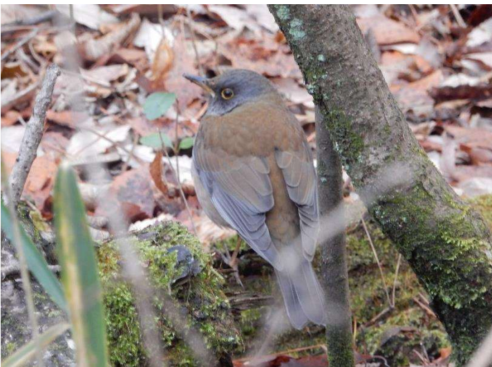
◇ 北高上冬の鳥 シロハラ 西砂防広場