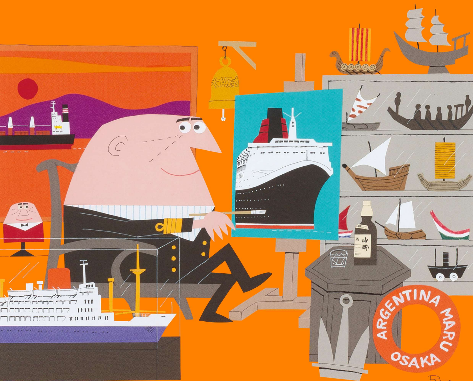
「アンクル船長の館」ポスター原画(部分) 2001年 | 大阪市立中央図書館蔵