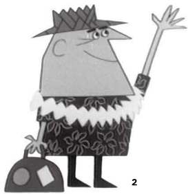
1. 水川丸と山下公園 1968年 | 横浜みなと博物館蔵 2. トリスでハワイ篇「トリスウスイキー」テレビCMより 1961年 | 3. 「しろうぼうていしゅうどうせよ」原画 1964年 | さく(渡辺茂男) | 福音館書店 | 横浜みなと博物館蔵 4. 「人間」らしくやりたいナ.....「トリスウスイキー」新聞広告原画 1961年 | 大阪市立中央図書館蔵 5. 『のりものいっぱい』原画 2003年 | こくま社 | 横浜みなと博物館蔵 6. にっぼん丸(星座) 2008年 | 商船三井蔵 7. 自作模型船の本「コムパス」1946年 | 大阪市立中央図書館蔵 8. アンクルトリス橋校入れ 1960-2000年代 | 大阪市立中央図書館蔵 9~11. アンクルトリス ベン画 | 横浜みなと博物館蔵

切り絵による独特なスタイルによって築かれた、ユーモアと卓越した造形感覚が光る創作世界をぜひご堪能ください。昭和を彩った大衆文化の軌跡とともに、柳原が生涯愛し続けた「船」の魅力に迫ります。